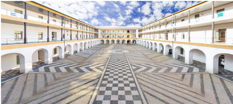
FACULTAD DE EDUCACIÓN, ECONOMÍA Y TECNOLOGÍA DE CEUTA