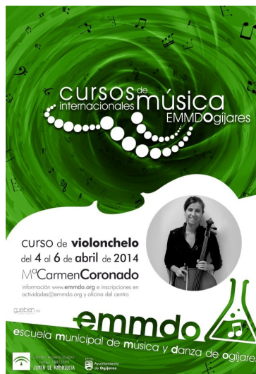
Cursos internacionales de música EMMDO en Ogijares