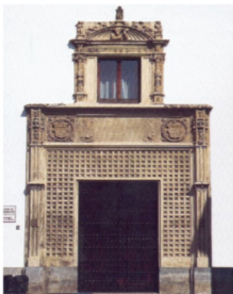
Taller de composición Rafael Orozco en Córdoba