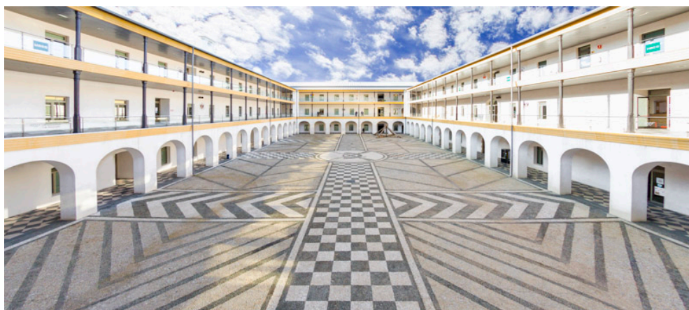
FACULTAD DE EDUCACIÓN, ECONOMÍA Y TECNOLOGÍA DE CEUTA