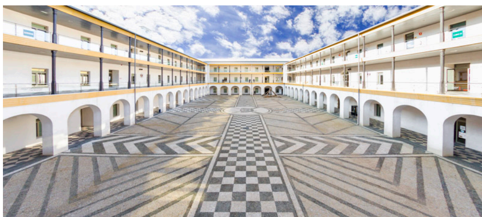
FACULTAD DE EDUCACIÓN, ECONOMÍA Y TECNOLOGÍA DE CEUTA