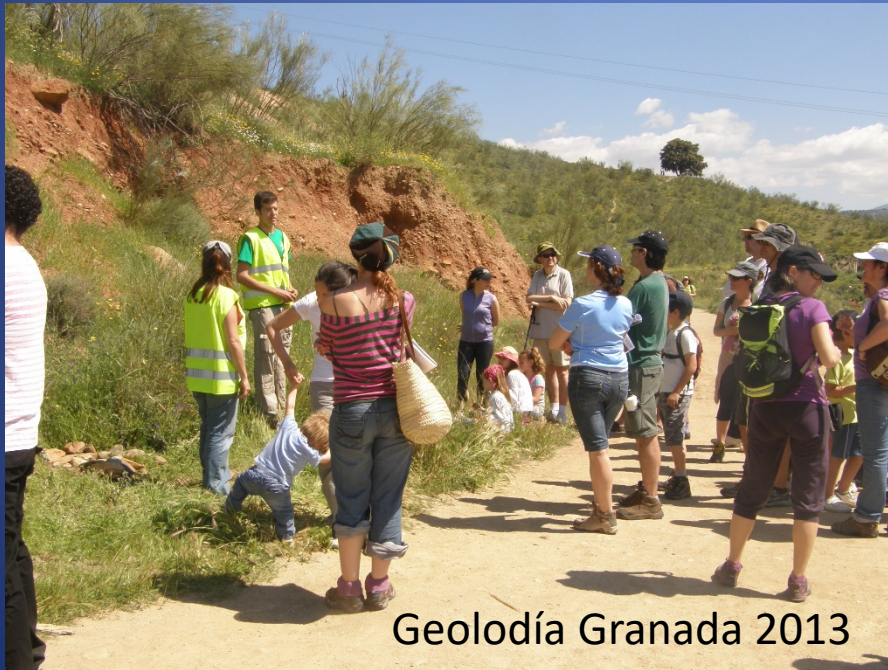
Geolodía Granada 2013