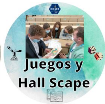
Juegos y Hall Scope