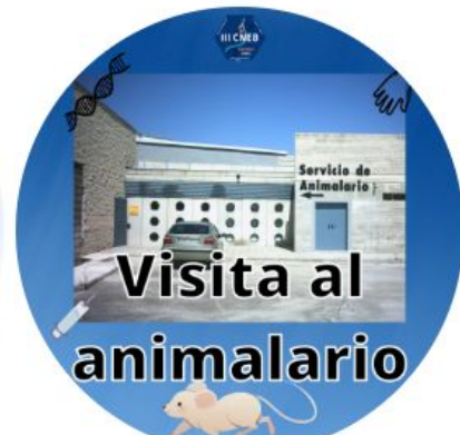
Visita al animalario