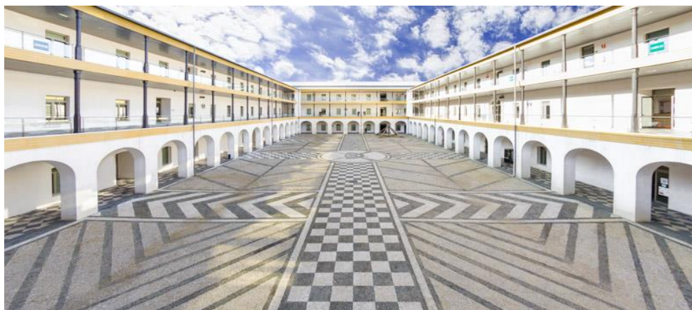
FACULTAD DE EDUCACIÓN, ECONOMÍA Y TECNOLOGÍA DE CEUTA