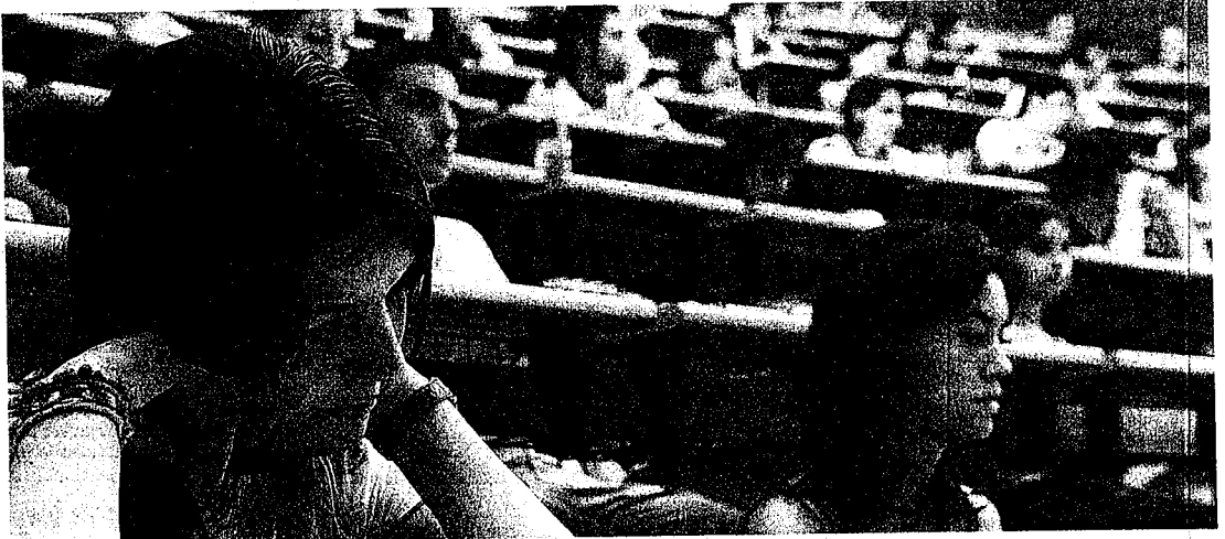
Es conveniente que los universitarios sepan qué es lo que buscan las empresas para adaptarse al mercado laboral.

Un dato curioso que destaca este informe es que la rama de Humani-