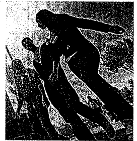
El 42% de los jóvenes está en paro.

Sobre las medidas concretas que introduce la Reforma laboral y que afectan directamente a este colectivo, Pérez explica que "se introducen algunos cambios en los contratos en prácticas y en los contratos para la formación que son los que están dirigidos a este colectivo de jóvenes. No se crea ningún contrato nuevo, pero sí introduce pequeñas modificaciones sobre los que ya están recogidos en la normativa vigente". Ambos contratos, el de prácticas y el contrato para la formación, están sujetos a un límite temporal, que como regla general se encuentra entre los seis meses y los dos años de duración. La Ley 35/2010 incluye como novedad a este respecto el hecho de que las situaciones de incapacidad temporal, riesgo durante el embarazo, maternidad, adopción o acogimiento, riesgo durante la lactancia y paternidad, interrumpen el cómputo de la duración del contrato. El Real Decreto Ley 10/2010 amplió además los títulos que habilitan para la celebración del contrato en prácticas, certificados de profesionalidad y titulaciones universitarias, y amplió de cuatro a cinco años el periodo que puede transcurrir desde que se obtiene el