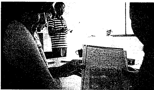
En el 74% de las ofertas, el dominio de inglés es requisito indispensable.

título hasta que se celebra el contrato de trabajo. Más tarde, la Ley 35/2010, de nuevo amplió este periodo de tiempo para los trabajadores discapacitados, pasando de seis años, antes de la Reforma Laboral, a siete, según la normativa vigente. El contrato para la formación, también ha sufrido algunos cambios tras la Reforma Laboral. Se suscribe con trabajadores que no están en posesión de un título que habilite para la celebración de un contrato en prácticas, siempre y cuando los trabajadores tengan entre dieciséis y veintidós años. La Reforma amplía los colectivos en los que no resulta de aplicación este límite de edad. Como novedad, además se introduce la necesidad de recibir la formación teórica que acompaña a este tipo de contrato, siempre fuera del puesto de trabajo. Se entenderá además que se ha cumplido el requisito de la formación, cuando la Administración certifique que se ha realizado un curso de formación profesional adecuado a ese puesto de trabajo, y con una duración equivalente a la formación que la empresa le hubiera proporcionado.